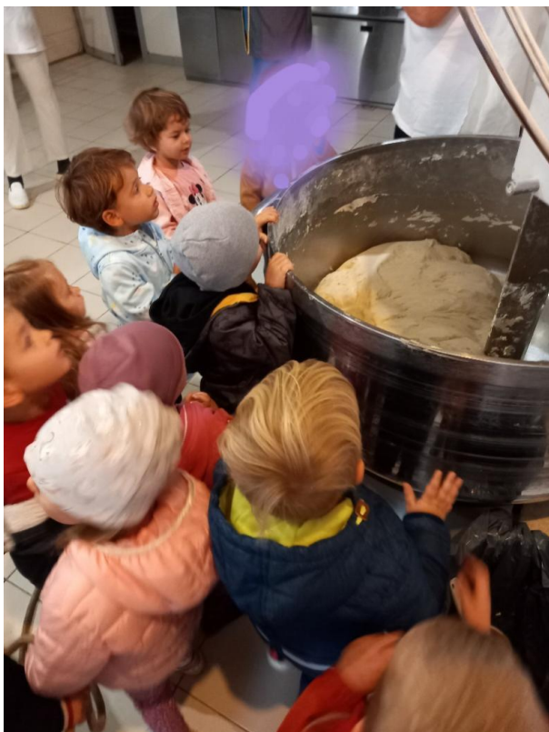
20.10.2022. Svjetski dan jabuka